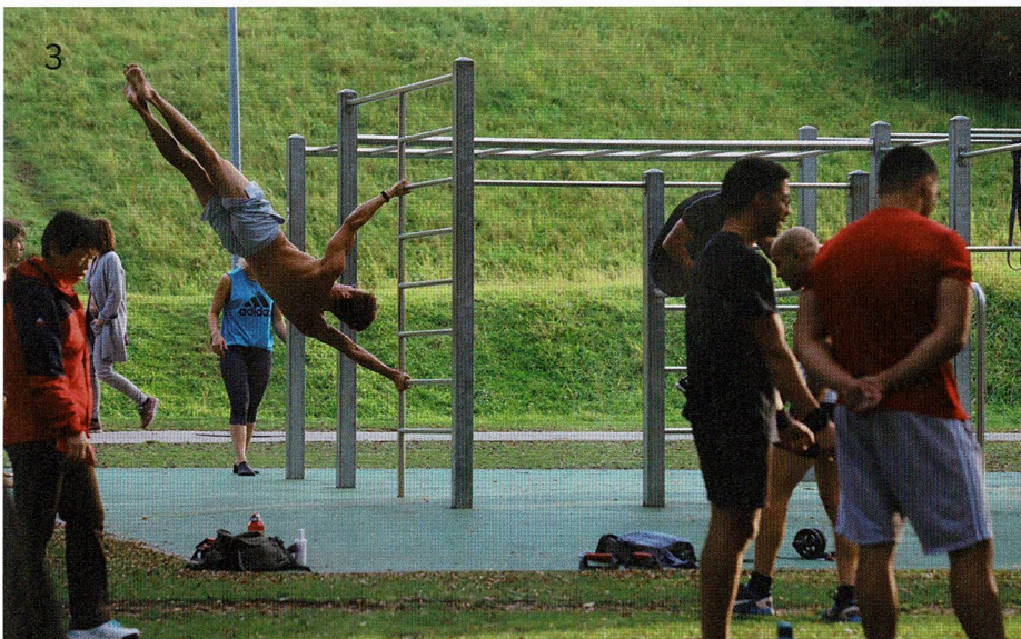
3 | Ein typischer Bewegungsort mit einer stark männlichen Ausprägung.