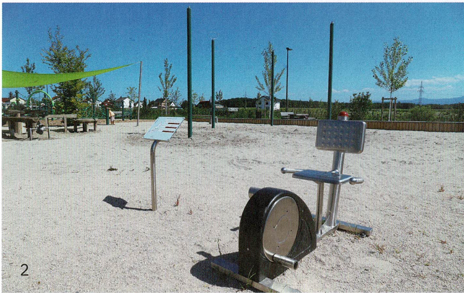
2 | Bewegungsförderung gut gemeint und schlecht gemacht – es reicht nicht aus, einfach nur Bewegungsgeräte aufzustellen.